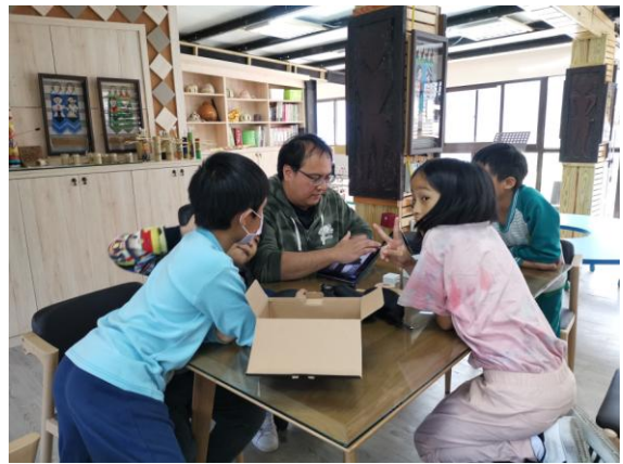
運用電腦設定進行雷雕