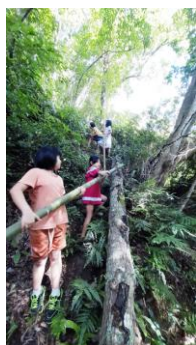
先到下宿舍邊砍竹子