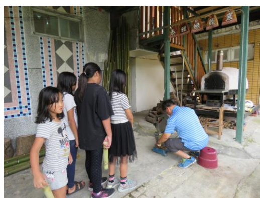
將竹子鋸成適當的長度