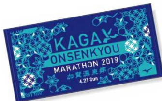
60cm*120cm Made in Japan