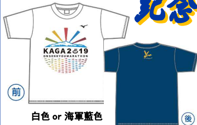
白色 or 海軍藍色